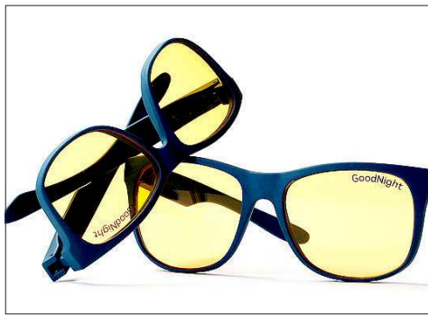
INNOVATION. La lunette filtre et bloque l'essentiel des ondes courtes à forte énergie.